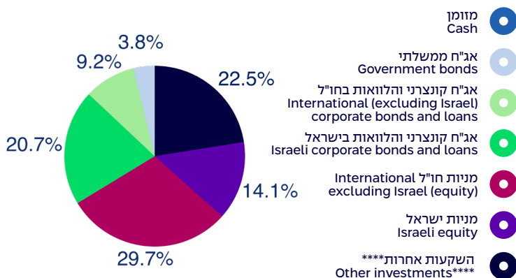
הרכב נכסים במונחי שווי ליום 31/10/2024 Composition of assets, by exposure, as of 31/10/2024

Investment policy: The track assets will be exposed to various assets, subject to the provisions of the law. The assets will be invested at the discretion of the Investments Committee, taking into consideration, inter alia, the ages of the beneficiaries in each track.***