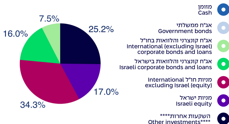
הרכב נכסים במונחי שווי ליום 30/11/2024 Composition of assets, by exposure, as of 30/11/2024

Investment policy: The track assets will be exposed to various assets, subject to the provisions of the law. The assets will be invested at the discretion of the Investments Committee, taking into consideration, inter alia, the ages of the beneficiaries in each track.***